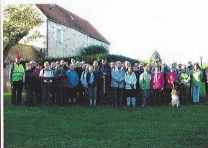
90 randonneurs à la rando pommes, noix et potirons