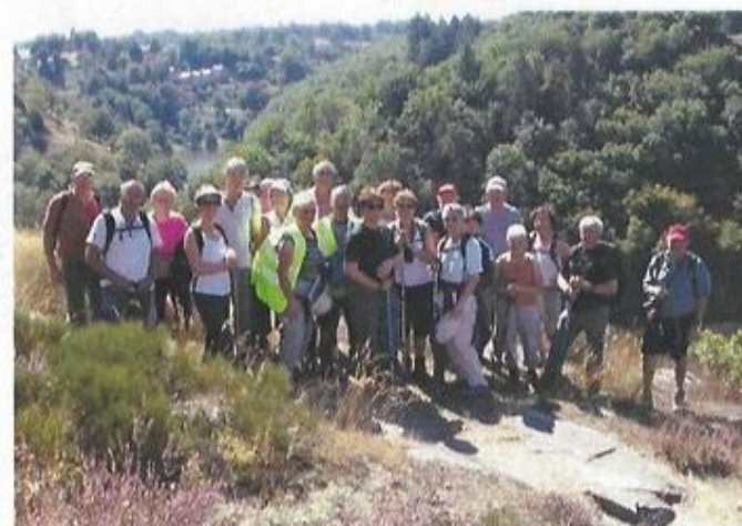
30 randonneurs dans le Val de Creuse. Des sentiers plus ou moins ardu de toute beauté le long de la creuse. Le musée de la chemise et de l'Élégance masculine a ravi les hommes.