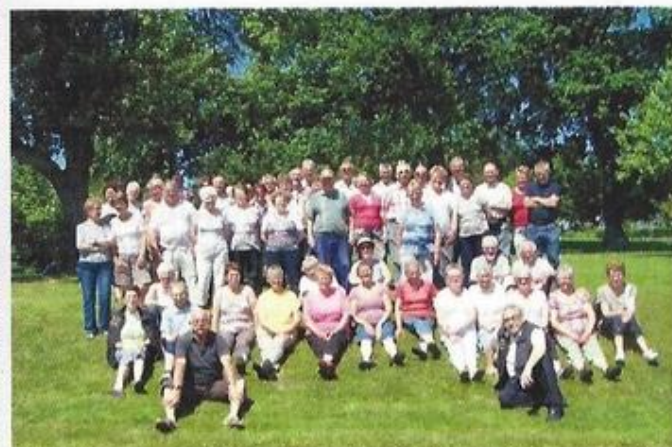
Journée pique-nique au pays de l'ardoise, aidé par le club local, découverte des sentiers et du musée de l'ardoise.