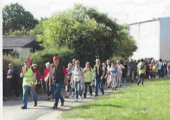
250 randonneurs à la semi-nocturne, pot de l'amitié, tombola et soupe à l'oignon à l'arrivée.