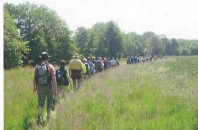
Ambrières les vallées, 63 randonneurs dans le Haut mayennais et visite de la laiterie Besnier à Laval